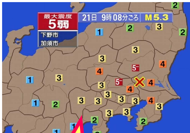
NHK じしんそくほう 地震速報