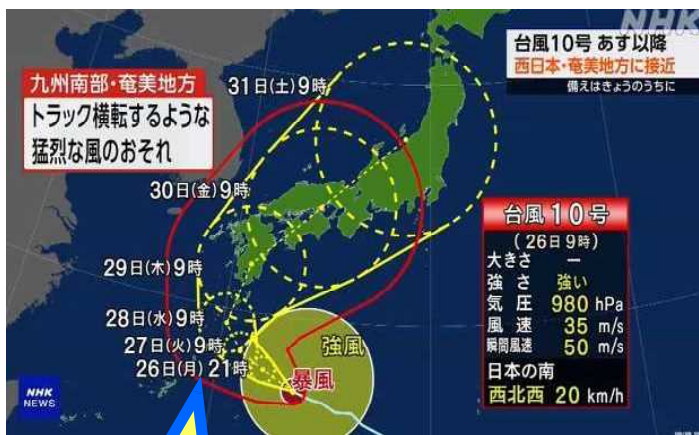
NHK たいふう しんろ よそう 台風の進路予想