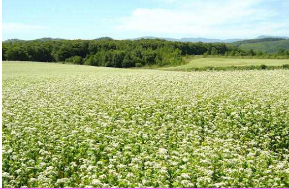
そば畑 (80日・荒れ地でもOK)