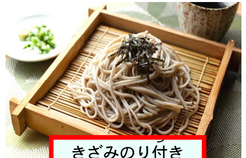
きざみのり付き 「ざるそば」

【ふりかえり…】 ◇江戸の さんみ (寿司・てんぷら・そば) の歴史は、わかったかな？ ◇日本人は、大昔から「そば」を食べていた。 ◇醤油づくりの発達 → 「寿司・そば」が広まった。