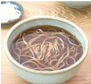
あたたかいそばつゆ 「かけそば」

えどじだい なか 江戸時代の中ごろ に はち や たい 「二八そば」の屋台 ① そば粉 8 ・ 小麦粉 2 の割合 ② 2 \times 8 = 16 (値段が16文だった) ③ 「ゆでそば・醤油つゆ」 になった。