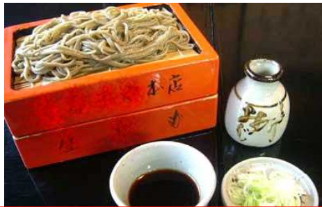
つめ 冷たいそばつゆ「もりそば」