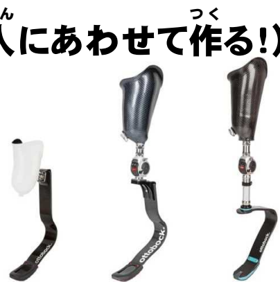
きょうぎょうぎそく 競技用義足