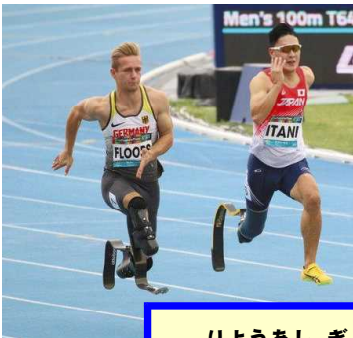
りょうあしぎそく かたあしぎそく 両足義足・片足義足