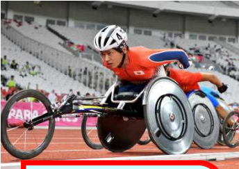
りくじょうきょうぎ 陸上競技