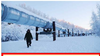
てんねん おく 天然ガスを送るパイプライン