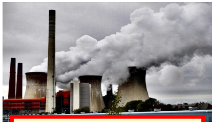
だ せきたんはつでん CO2を出しまくる石炭発電