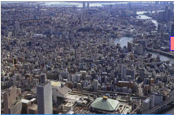
た なら いま りようこく ビルが建ち並ぶ 今の両国