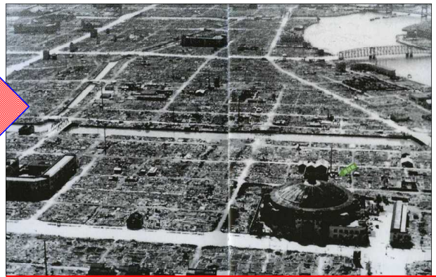
くうしゆう や のはら りようこく 空襲で焼け野原になった両国