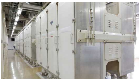
② 「から・かわ」をはずす