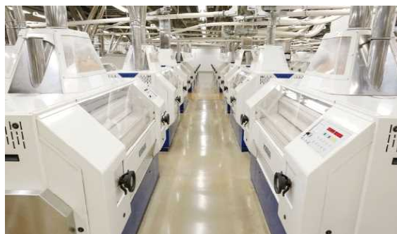
③ 「かす」をとる・粉にする