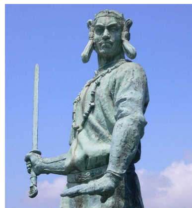
ひと この人がヤマトタケル