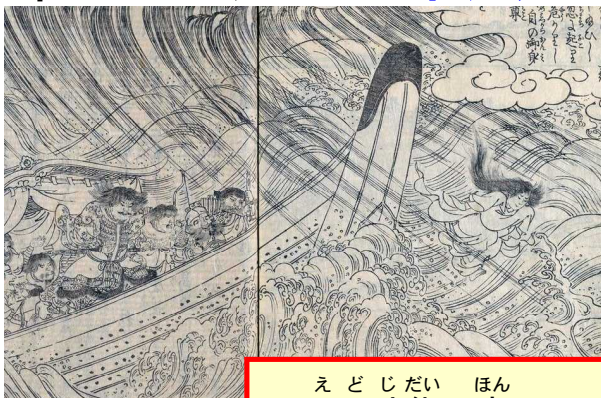
えどじだい ほん 江戸時代の本より