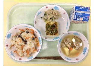
5/15の給食『広島県の郷土料理』 もぶりごはん、お好み焼き風、にじゃー、八寸

また、5月にはG7サミットの開催に合わせ、広島県の郷土料理を提供しました。今後も、児童が様々な文化について興味をもつきっかけとなるよう、日本の郷土料理や、世界の料理を提供していきます。