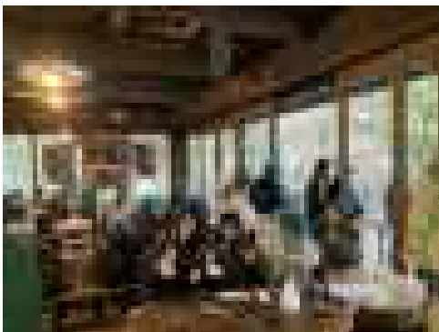
← 竜頭の滝ではPT Aからお団子のおやつをいただきました。