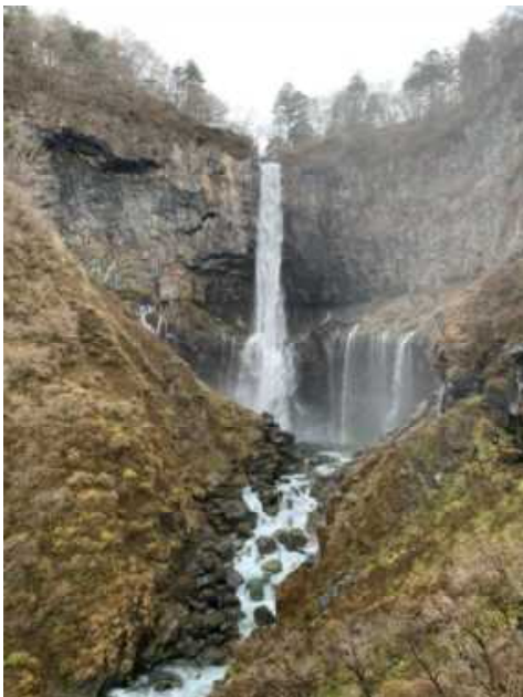
華巖の滝にはなんと特別天然記念物のカモシカが姿を現してくれました。