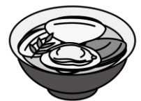
はまぐりのお吸い物

3月3日は「ひな祭り」。女の子の健やかな成長を願ってお祝いをする日本の伝統行事です。現在のように、ひな人形を飾るようになったのは江戸時代のことで、もとは人形を身代わりにして邪気をはらう「流しびな」が起源とされます。行事食として、ちらしずし、はまぐりのお吸い物、ひしもち、ひなあられなど、華やかな食べ物が並びます。