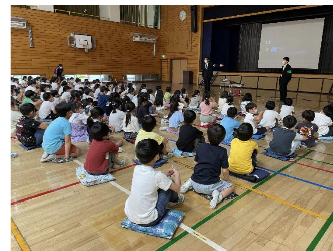
▲警察の方のお話を真剣に聞くことができました。