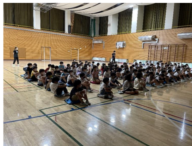
▲身近にある危険について学びました。

先月は3日に分けて、「セーフティ教室」が行われました。今年度は感染症対策を考慮して、児童のみの参加で行われました。低学年・中学年は連れ去りや万引きについて、高学年はSNSに関するトラブルを中心に、向島警察署の方々からお話を聞いたり、DVD視聴を行ったりしました。