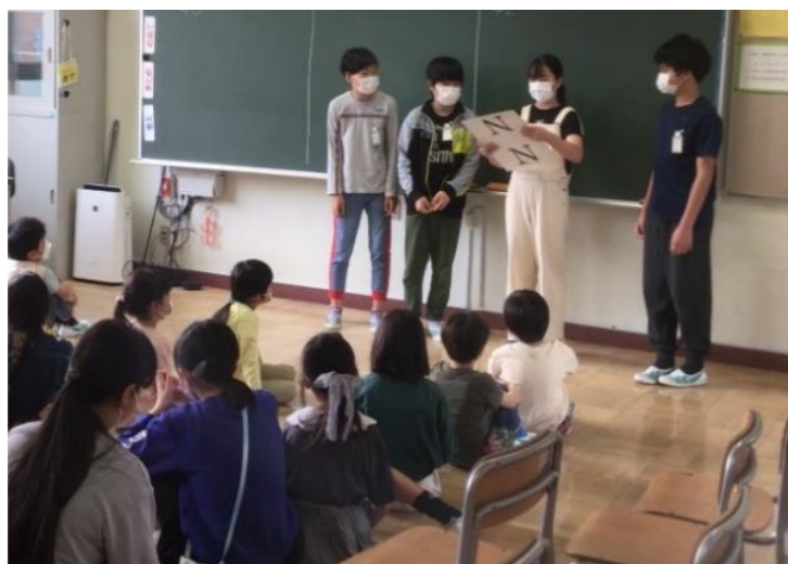
▲6年生の説明を下級生が静かに聞いています。

5月7日(土)の1時間目に、今年度初めてのたちあづ班活動が行われました。班ごとに分かれて自己紹介をし合ったり、6年生が準備をしたゲームで遊んだりして、異学年同士の交流を深めることができました。緊張しながらも一生懸命班をリードしてくれた6年生。これからの活躍が楽しみです。