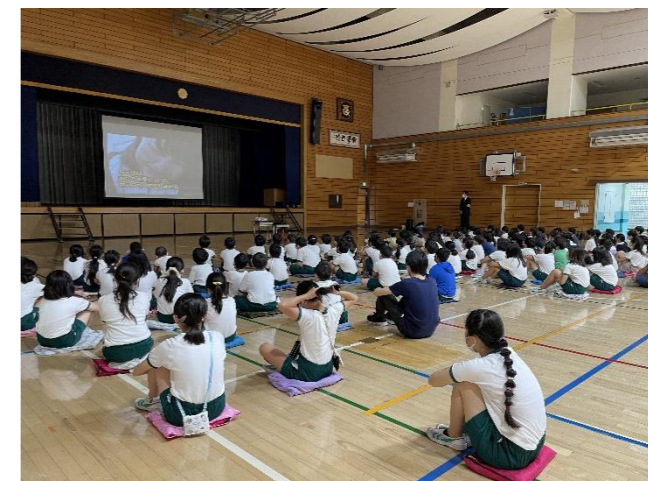
▲動画も見ながら、学びを深めました。