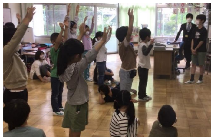
▲命令ゲームで大盛り上がり♪