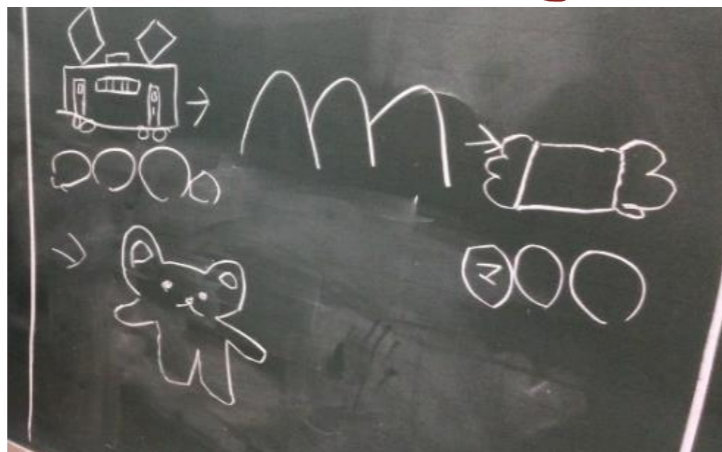
▲黒板で絵しりとり。上手くかけたかな？