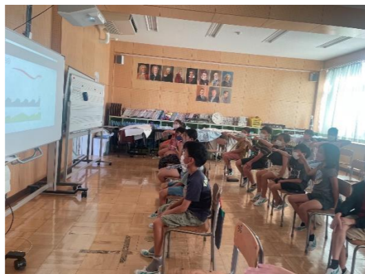
▲3年生 音の動きを手で表現！