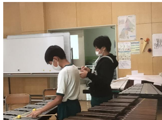
◀6年生 違うパートと 音を合わせて…！