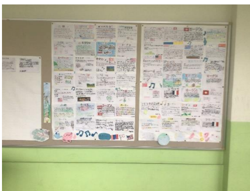
▼5年生 世界の音楽を調べたよ！