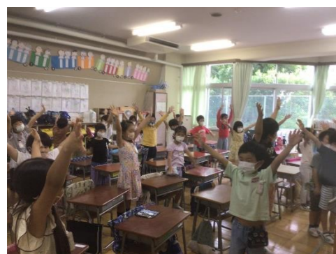
◀1年生 ドレミの体操♪

1・2年生はキーボードの学習がはじまりました。体を動かしながらドレミについて学んだり、歌に合わせて演奏をしたりしています。3・4年生は鑑賞の学習に取り組んでいます。図形になった楽譜をなぞりながら音楽を聴いたり、本物の楽器に触れたりして、曲の面白さを感じとったり、楽器の特徴について学んだりすることができました。5年生は世界の音楽を鑑賞し、興味のある音楽について調べてカードにまとめる活動をしました。6年生は10月に行われる立吾小15周年記念式典に向けて、合奏の練習を頑張っています。