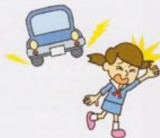
●通学途中で車に はねられてケガをした