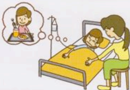
●給食を食べて 細菌性食中毒により入院した