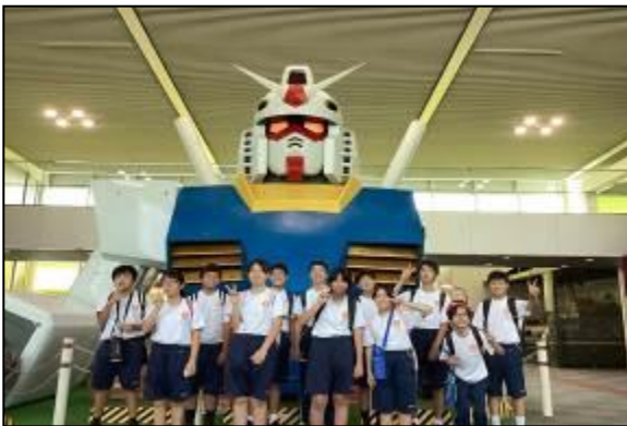
1 / 1 原寸大 ガンダム 胸像

F組を含めた特別支援学級5校合同の社会科見学として、「おもちゃのまち BANDAI MUSEUM (栃木県)」等に行ってきました。MUSEUMは、日本、世界、エジソン、ガンダムの4テーマで構成されており、生徒は、数々の作品に魅了されていました。