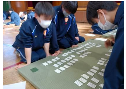
「2年生：百人一首大会（体育館に青畳を敷き5～6人で対戦）」