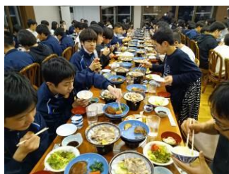
「みんなと食べる食事は特においしい」