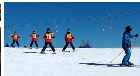
「初めてのスキーでもみるみる上達」