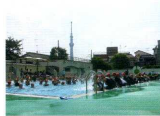
水泳教室(今年度中止)