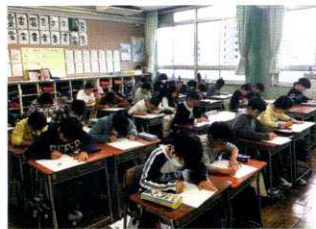
スピードトライアル