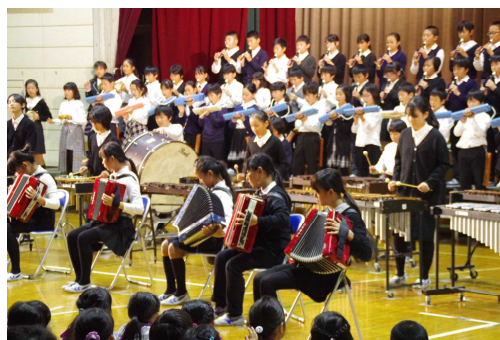
6年生の圧巻の演奏『天国の島』