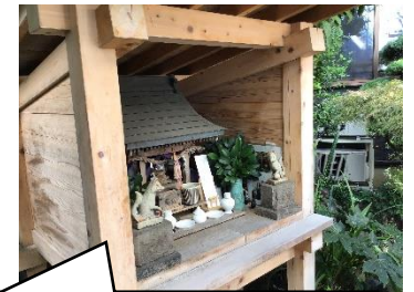
工場の敷地内には鉛筆の形をした看板や、短くなった鉛筆を供養する神社がありました。