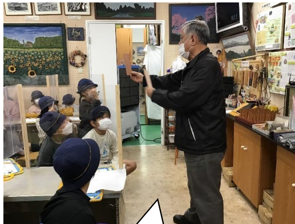
工場の方から鉛筆の作り方の説明を聞いています。