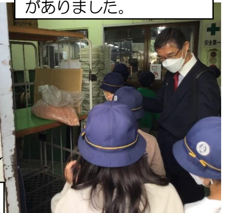
これは「おがくず」です。リサイクルでいろいろなものになります。