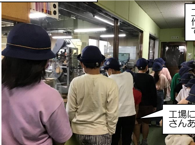
工場には機械がたくさんありました。