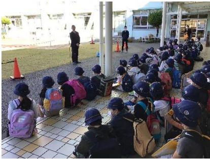
出発式の様子です。

11月2日（水）に社会科見学に行きました。鉛筆工場や、墨田区内をバスから見学しました。1・2年生のときにはコロナ禍でできなかった校外学習を今年は経験でき、子供たちも喜んでいました。