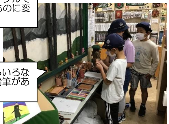
工場にはいろいろな工夫された鉛筆がありました。