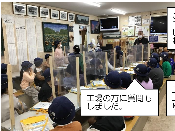
工場の方に質問もしました。