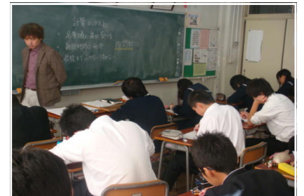
<う～ん。もうすぐ時間だ・・・>

本校では、国語・数学・英語の3教科の基礎学力を高めるために、年間計画の中に三大コンテスト(漢字コンテスト・読解コンテスト・スピーキングコンテスト)を取り入れています。今回は、計算コンテストです。みんな100点満点を目指して必至にがんばっていました。後日の採点結果が楽しみです。スプリングコンテストは11月29日に実施予定です。