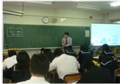
<3年数学発展コース：電子黒板を使つての授業>

本校は昨年度から2年間、都から習熟度別少人数の研究推進校として指定され、数学と理科で研究を進めてきました。今年度はその2年目にあたります。11月22日には3年生の数学科で3つのコースに分かれて研究授業を行いました。本校の研究について、11月から12月にかけて福井・鳥取・長崎・京都・富山・静岡・熊本・宮崎などの県教委や校長をはじめ教務主任の先生方が管外出張で来校され、その成果を見学していただきました。