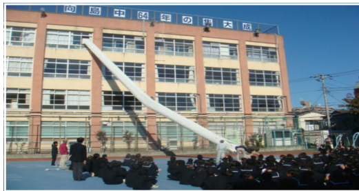
<4階にある救助袋を使用する避難訓練>

定期考査の最終日、3校時のテスト終了後、火災を想定して避難後、4階に取り残された生徒が救助袋を使用して避難するという訓練を行いました。全員が真面目に一生懸命取り組んでいました。各学年2名ずつが降りてくる設定でしたが、生徒が救助袋から顔を出すと大きな拍手で迎えられていました。