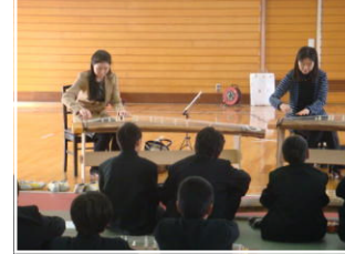
←「六段の調べ」模範演奏