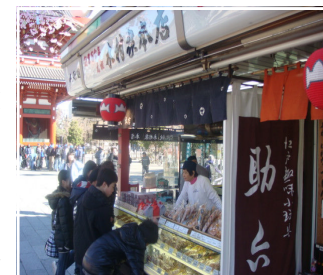
<浅草寺仲見世にて> <調理室にて>

「上野・浅草方面」に行ってきました。今回は、班ごとに主体的に計画立案を行い規律の大切さや自らルールとマナーを守る姿勢を育てる目的で実施しました。どの班も上野・浅草で新しい発見があったようです。