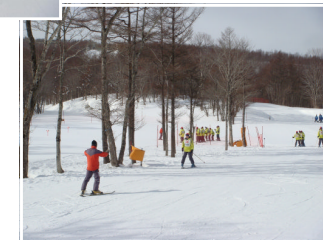
<スキーの先をハの字に 前を見て～！>