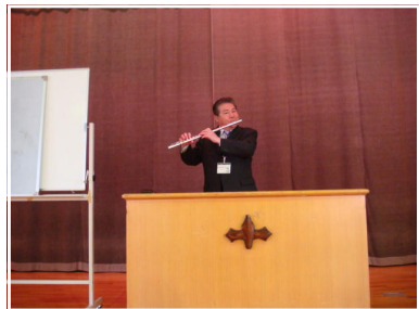
新しいことに挑戦したり、区切り

今年の干支は卯年ですね。このことを本で調べてみると、子年(ねずみ)は十二支の最初ということで種をまくのに適した年、次の丑年(うし)は、まいた種が芽を出し成長するのを忍耐強く見守る年、次の寅年(とら)はその芽が勢よく伸びはじめる年だとされています。そして卯年(うさぎ)は、その芽が若葉となり成長していく年だそうです。たくさん枝葉が伸びることから競争が激しくなることも予想されますが、全体的に見れば新たな活気が生まれてきますから、新しいことに挑戦したり、区切りをつけ、心機一転頑張るのに適した年といえるでしょう。