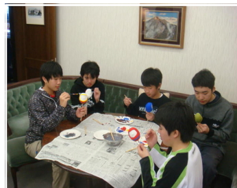
<ペンションにて：だるま絵付け>