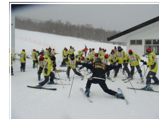
<滑走前のストレッチ しっかりやろう！>

1月26日～28日、福島県南部にある羽鳥湖スキーリゾートに行ってきました。雪国ではめずらしく1日目と2日目の午前中は青空という素晴らしい天候にも恵まれ、パウダースノーのグレンデで全員がスキーの楽しさを体験することができました。最終日には、全員がリフトに乗って頂上まで行き、滑って降りてこられるまでに上達しました。習熟度に合わせて8名のスキーのインストラクターからの丁寧な指導、また、宿泊する6つのペンションでは、心のこもったオーナーからのおもてなしを受け、有意義で思い出に残る移動教室にすることができました。