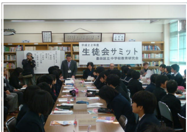
<図書室での全体会>

本校図書室において、墨田区立中学校生徒会サミットが開催されました。区内の生徒会役員41名が、「校内生活の改善」「福祉ボランティア」「環境1」「環境2」の4つのグループに分かれて、各校で実施している活動について、発表しました。今回は、区民活動推進課との連携のもと、「すみだ やさしいまち宣言」と関連づけて実施しました。