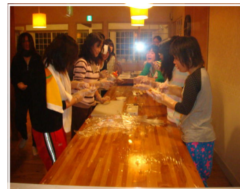
<ペンションごとの体験活動>