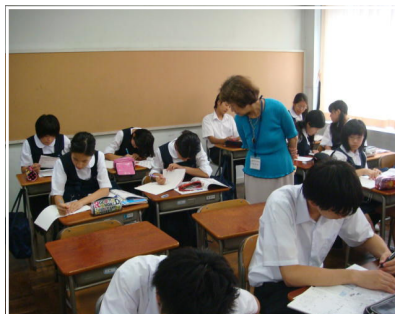
<向島ゼミナールで実力アップ！>

今年度の学力向上の一環として、「向島ゼミナール」と名付け、毎週火曜日と金曜日の午後4時から5時まで三階視聴覚室にて自学自習の時間を設けました。学習習慣を身に付けること、また、基礎学力の向上を目的として国語・数学・英語の3教科を外部講師に指導を受けられるものです。前期は、1年生から3年生まで45名の申し込みがあり、6月29日に開講式を行いました。夏休み前までに5回実施することができましたが、落ち着いた環境の中で、取り組むことができています。また、夏休み中、各学年の補習にも向島ゼミナールの講師の方にお手伝いしていただく予定です。