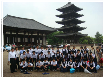
<早く撮って！小雨の奈良興福寺>