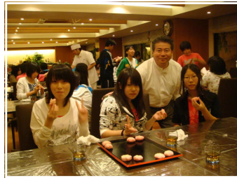
<うまくできた？和菓子づくり体験>