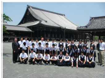
<暑い～！快晴の京都西本願寺>