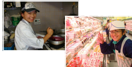
<働くことは大変だけど楽しいね>