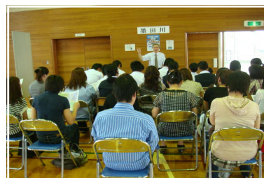
<真剣なまなざしで聞き入る生徒と保護者>

今年度の進路説明会は、新たな試みとして体育館に9校の高校をお招きして、ブース形式で詳しく説明を聞くことができました。