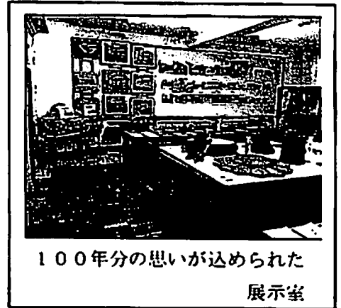
100年分の思いが込められた 展示室