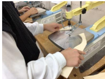
5年生図工「電動糸のこぎり」