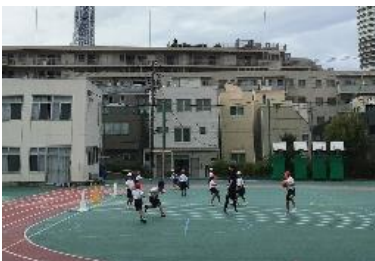
1年生体育「ボール運動遊び」

10月15日（火）から後期の学習がスタートしました。児童は、前期の振り返りをもとに、新たな目標を立てています。教室をはじめ、特別教室でも落ち着いて学習する姿が見られます。後期は、周年記念行事や学習発表会などに向けて、全校児童で力を合わせて頑張ります。