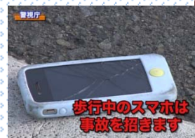
歩行中のスマホは事故を招きます

などの可能性が高くなります！ また、相手に怪我をさせようと、 過失傷害罪（30万円以下の罰金又は科料） に問われる可能性があります。