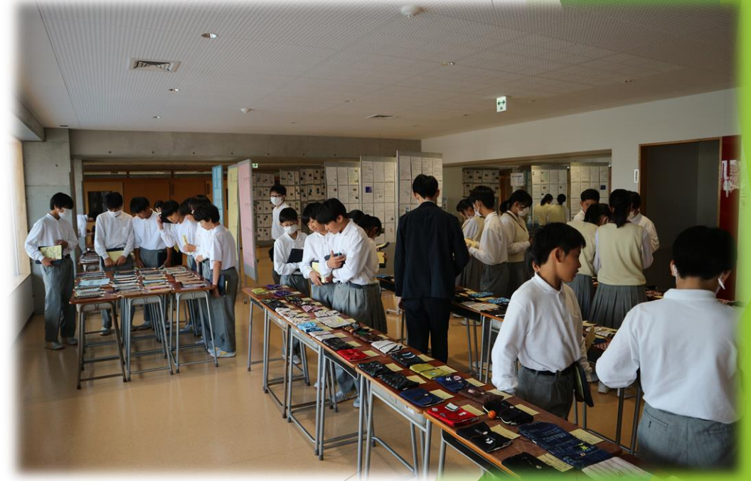
展示見学 (本校校舎内)