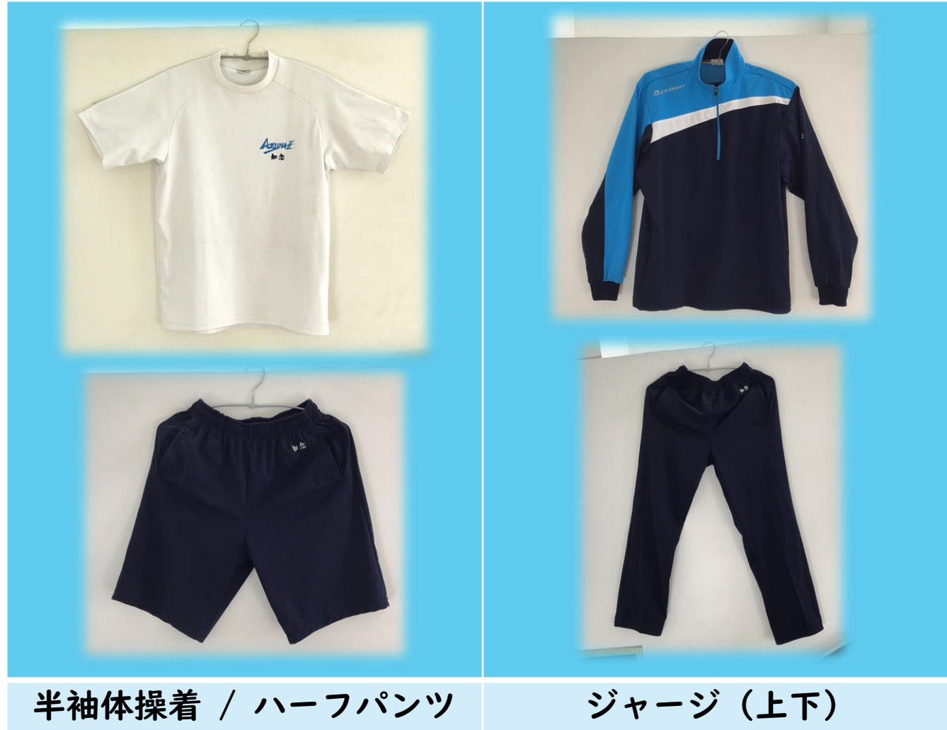
半袖体操着 / ハーフパンツ