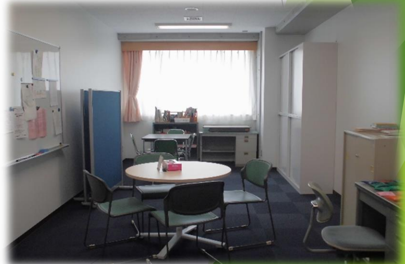
カウンセリングルーム