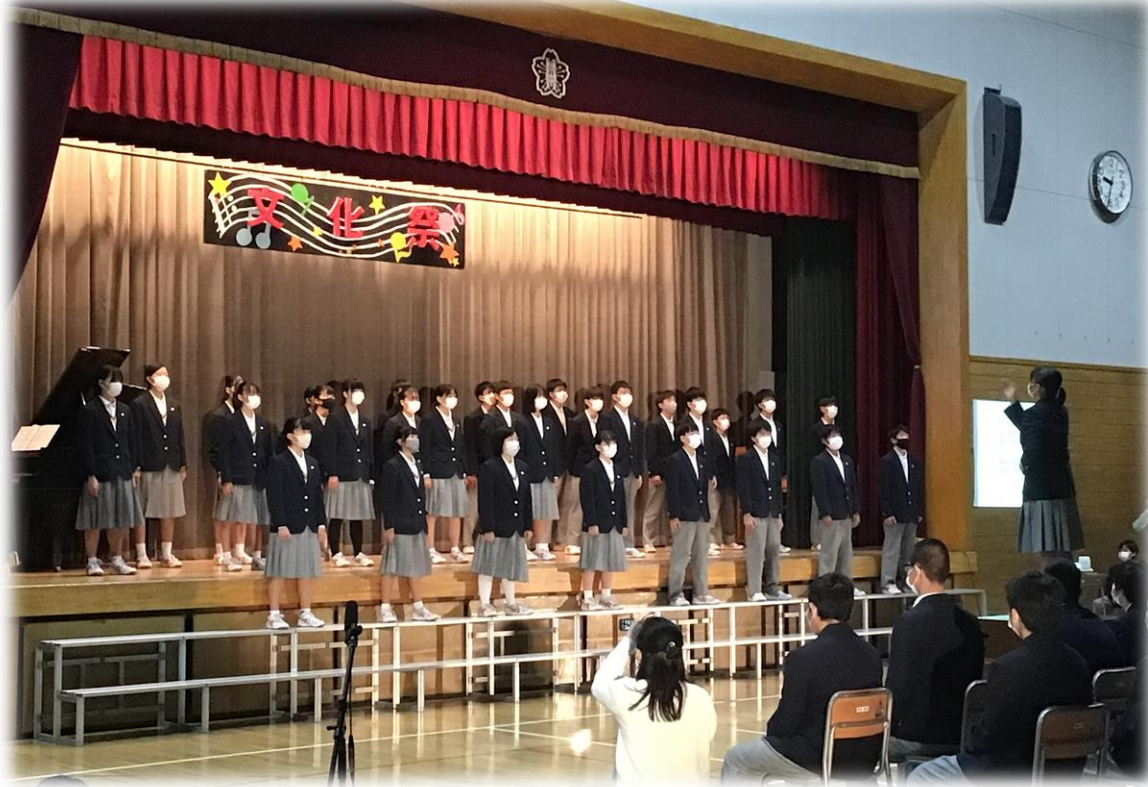
合唱コンクール (本校体育館)

*文化祭 (合唱コンクール・舞台発表・展示見学) 【今年度は10/26に実施します】