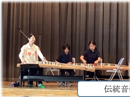
伝統音楽鑑賞教室