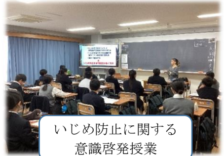
いじめ防止に関する意識啓発授業