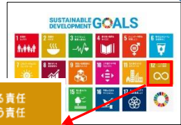
残菜減らそうキャンペーン

【内容】 給食時間を守り、給食(牛乳を含む)の完食を目指します。毎日給食室で残菜を計量し、5日間の残菜率を点数化し、点数の高い上位のクラスを、12月16日(月)生徒会朝礼で表彰します。*第一位の学級には「リクエスト給食券」を贈呈します。