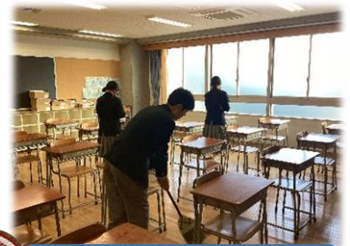
校内清掃ボランティア