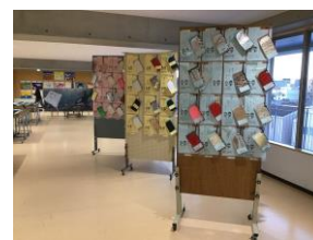
皮革細工体験(1年生)