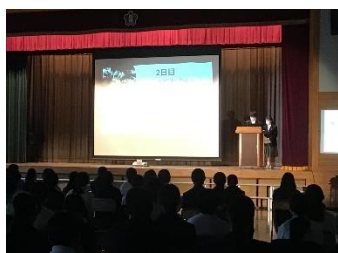
国内英語体験報告